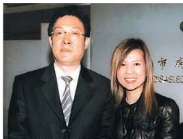
■Amanda與北京市副市長孫安民合照