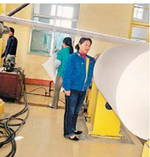
■群星紙業生產車間