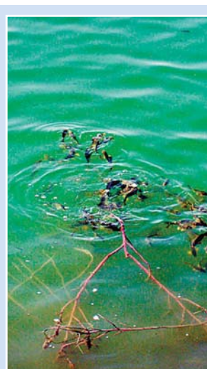
■群星紙業生產污水處理後可以養魚