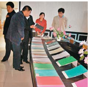
■群星紙業樣品陳列室