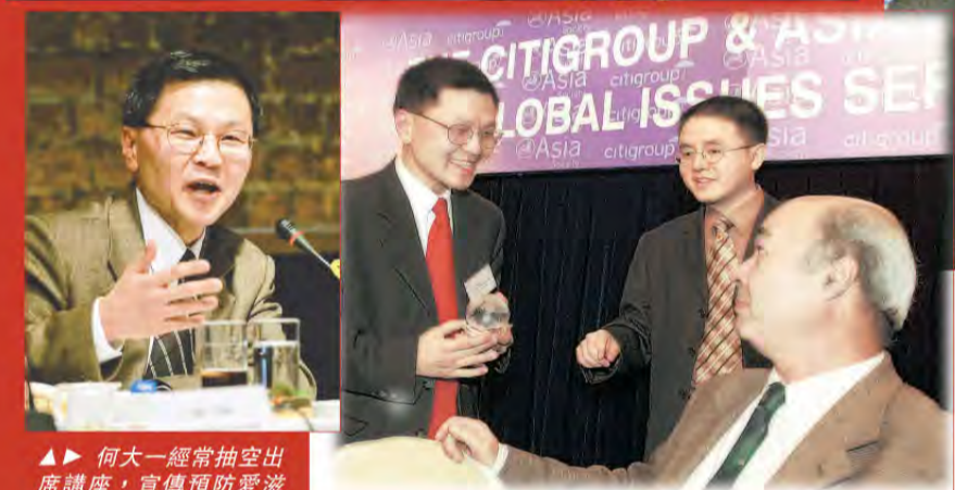
▲何大一接受美國加州州長阿諾舒華辛力加頒發的獎項