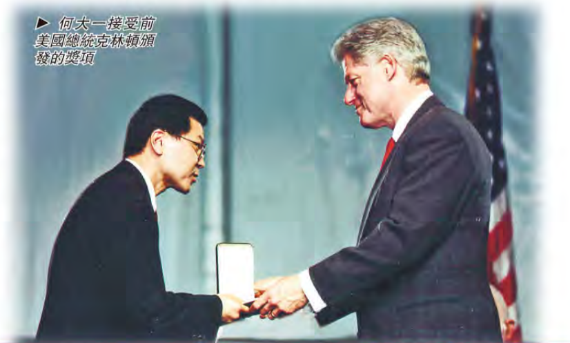
▲何大一接受前美國總統克林頓頒發的獎項