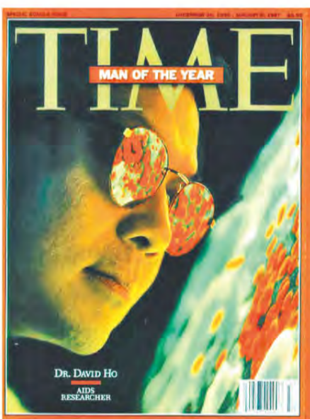
▲何大一於1996年獲《時代雜誌》選為風雲人物